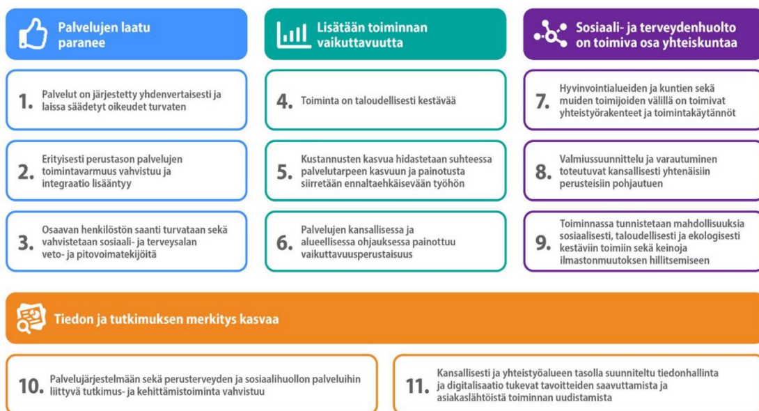
Kuva 2. Sosiaali- ja terveydenhuollon valtakunnalliset tavoitteet vuosille 2023–2026

Sote-järjestämislain 11 §:n mukaan jokaisen hyvinvointialueen, mukaan lukien HUS-yhtymän, on laadittava taloutensa ja toimintansa suunnittelua ja johtamista varten sosiaali- ja terveydenhuollon palvelustrategia osana hyvinvointialuestrategiaa. Palvelustrategiassa on otettava huomioon sosiaali- ja terveydenhuollon valtakunnalliset tavoitteet. STM on loppuvuodesta 2022 julkaissut sosiaali- ja terveydenhuollon valtakunnalliset tavoitteet vuosille 2023–2026 ( http://urn.fi/URN:ISBN:978-952-00-5427-4 ).