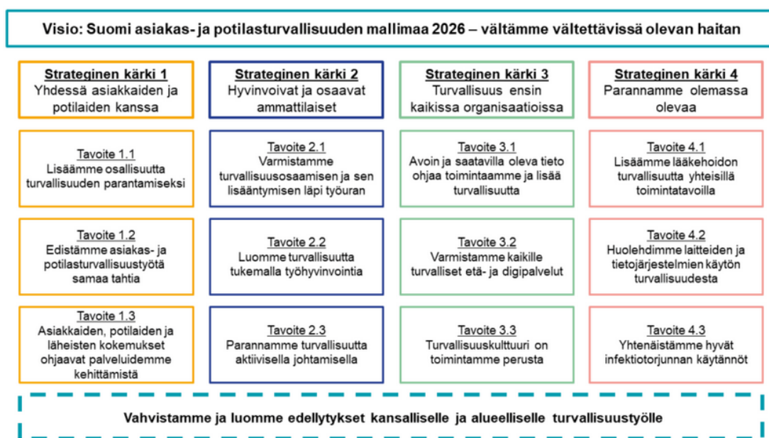
Kuva 3. Kansallinen asiakas- ja potilasturvallisuusstrategia 2022–2026.

Kansallisen asiakas- ja potilasturvallisuusstrategian päämäärien toteutumisen seurantaan on valittu kymmenen kärkimittaria, jotka sitouttavat Suomen WHO:n asettamiin tavoitteisiin (WHO Global Patient Safety Action Plan 2021–2030). Lisäksi strategian toimeenpanosuunnitelmassa on kuvattu mittarit, joilla seurataan toimenpiteiden toteutumista.