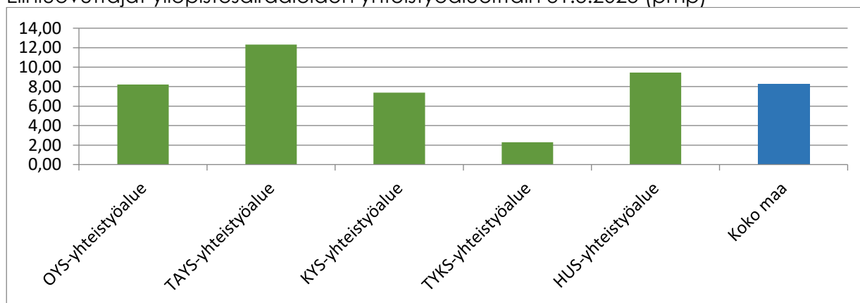
Elinluovuttajat yliopistosairaaloiden yhteistyöalueittain 31.3.2023 (pmp)

Yhteydenottoja potentiaalisista elinluovuttajista, jotka eivät toteutuneet oli 95. Yhteydenottoja oli lähes kaikista elinluovutussairaaloista.