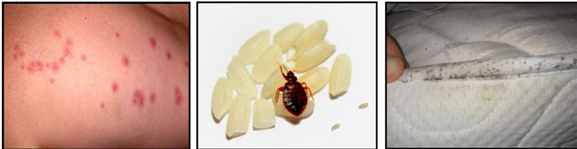
Kuvat: 1. puremia, 2. aikuinen lude riisinjyvillä, 3. luteen pistemäisiä ulostetahroja patjan saumassa

Luteen munat ovat tahmeapintaisia, joten tarttuvat helposti housunlahkeisiin tms. ja siten siirtyvät paikasta toiseen.