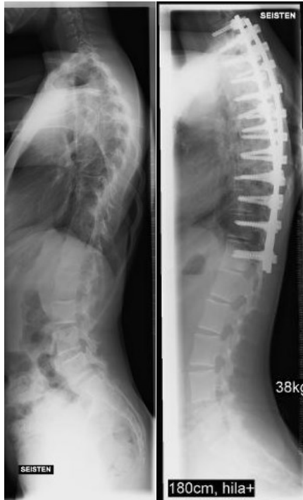
ilman hilaa ensimmäinen kuvaus